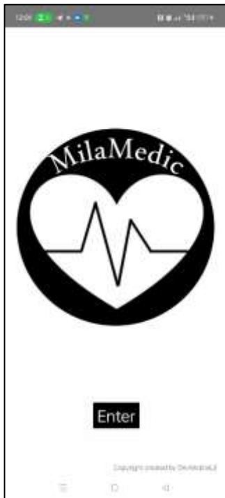
Figure 1a Splash screen (Portrait)