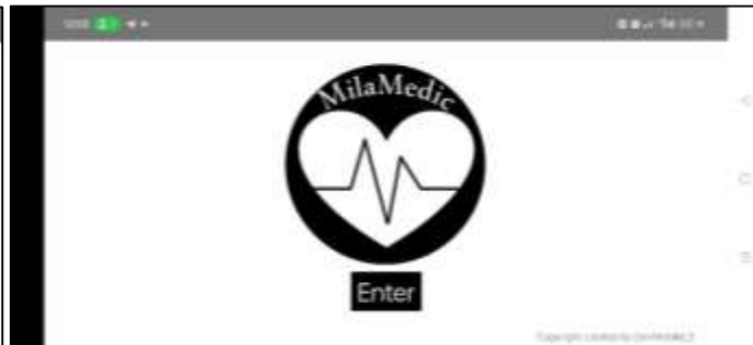
Figure 1b Splash screen (landscape)